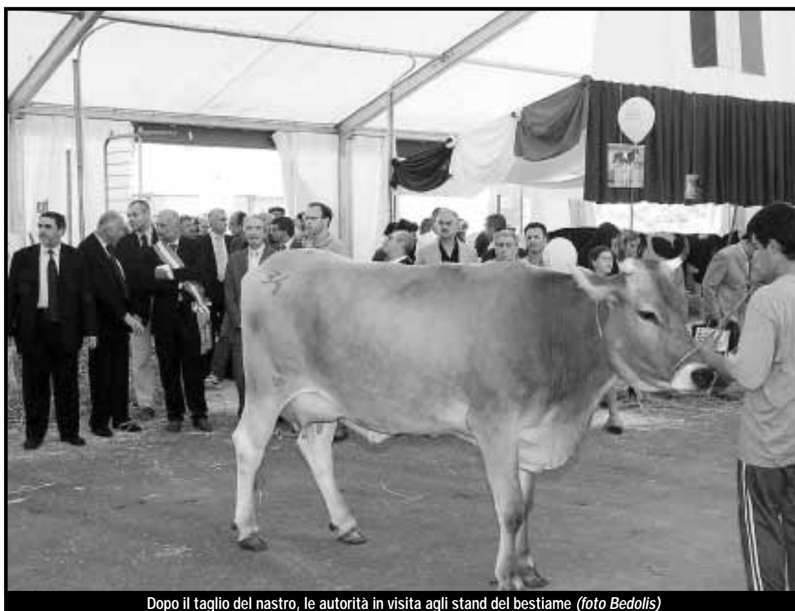
Dopo il taglio del nastro, le autorità in visita agli stand del bestiame